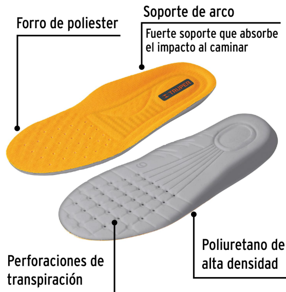
Forro de poliester