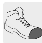
Casquillo de poliamida