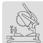
Para sierra de inglete