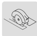
Para sierra de circular