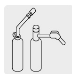
BOQ-PR, MECH-PR y SOP-201