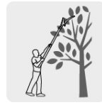
Extensión máxima 2.40 m