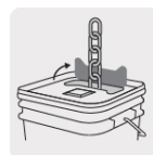
Tapa con pestaña desprendible