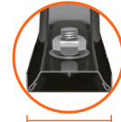
Soporte Calibre 15 (1.7 mm espesor)