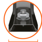
Soporte Calibre 15 (1.7 mm espesor)