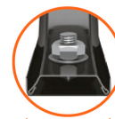
Soporte Calibre 15 (1.7 mm espesor)