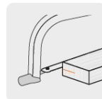
Corte a 180°