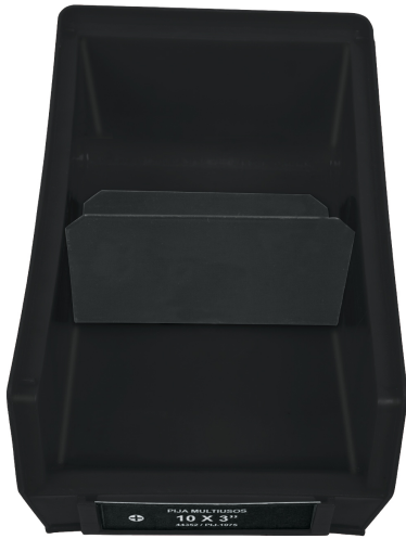
Gaveta para 2 códigos