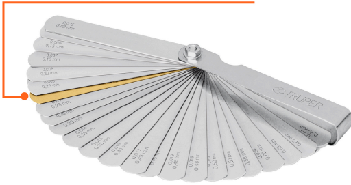
Hoja de latón para tomar medidas entre componentes magnéticos