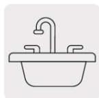
Para tarjas tipo bar