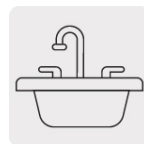
Para tarjas tipo bar