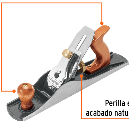
Perilla en acabado natural

Mango y perilla de madera para mayor comodidad y control