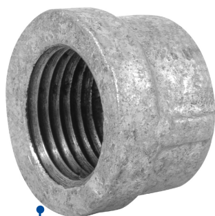
Conexión roscable de 1/2" NPT