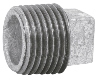
Conexión roscable de 1/2" NPT