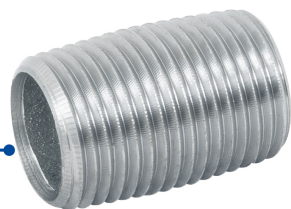
Conexión roscable de 1/2" (13 mm)