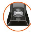
39 mm Soporte Calibre 15 (1.7 mm espesor)