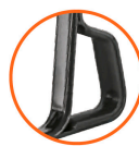
Nuevo tacón estabilizador con sujeción para descarga Calibre 15 (1.7 mm espesor)