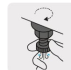
Válvula de drenado