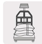
Barras de soporte que hacen más eficiente el pesaje