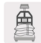
Barras de soporte que hacen más eficiente el pesaje