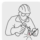
Uso en plomería