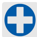
Punta de cruz