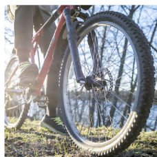
Llantas de bicicletas