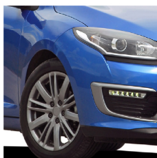
Llantas de automóviles