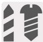
Taladro y destornillador