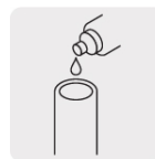
Aplica cemento solvente