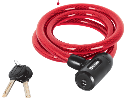
Cable de acero trenzado