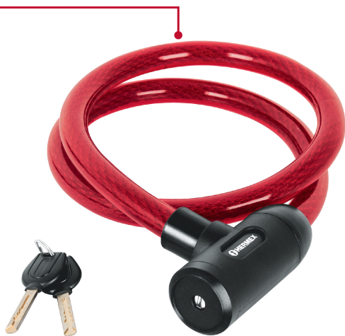
Cable de acero trenzado