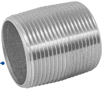
Conexión roscable de 1 1/4" (32 mm)