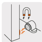
Sistema de imanes