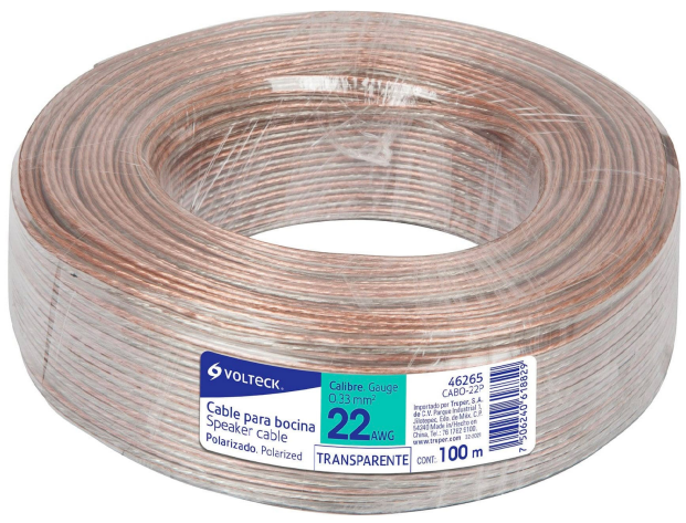
Rollo de 100 m