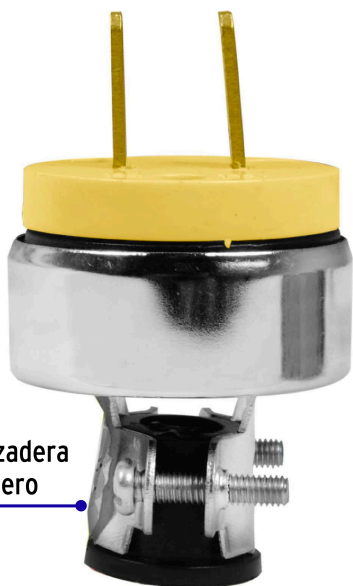
Abrazadera de acero