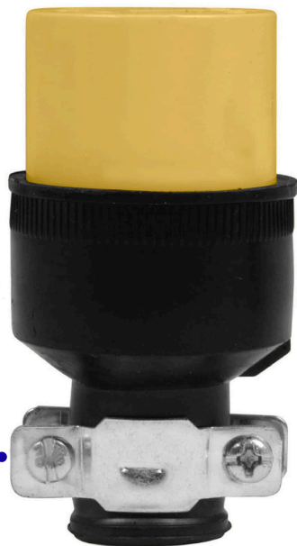
Abrazadera de acero