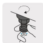
Válvula de drenado