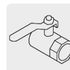
Salida para manguera de 3/4"