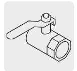
Salida para manguera de 3/4"