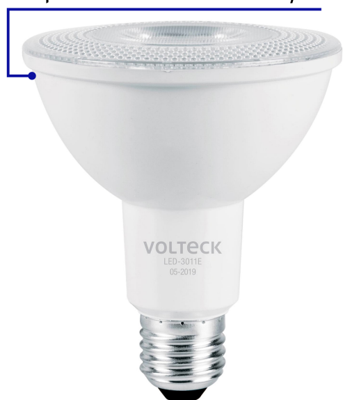
Cuerpo de aluminio revestido de nylon