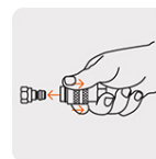
Conexión rápida de latón