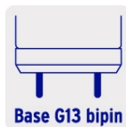
Base G13 bipin