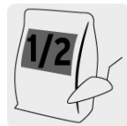
Capacidad 1/2 saco de cemento