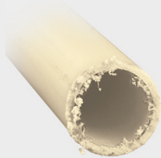
Corte con segueta