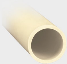
Corte con cortador de tubo

Para cortes en tubo de pared delgada, gire el tubo para facilitar el trabajo