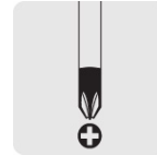
Punta de cruz