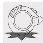
Resistente a impactos