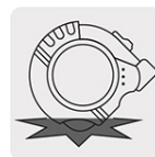
Resistente a impactos