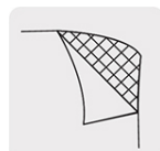
Respaldo de tela