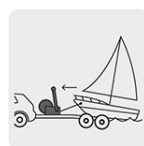
Remolque de embarcaciones