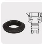
Empaque antifuga diseño cónico