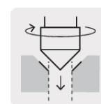
Para avellanados a 45°