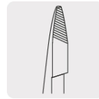
Mordazas con moleteado diagonal