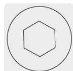
Entrada para llave allen