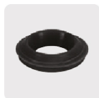
Empaque cónico antifuga