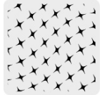
Tejido de punto en bolsas