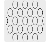
Malla al reverso