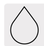
Para cortes en húmedo