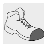
Casquillo de poliamida